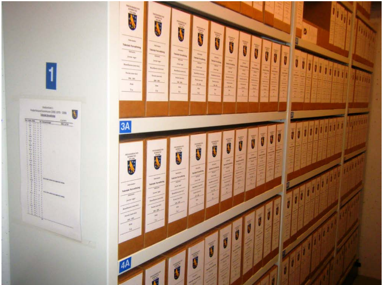
Foto: Arkivæsker med journalsager fra Teknisk Forvaltning, Frederikssund Kommune (1970-2006).